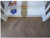
Band voor de trap.

Hoe bent u te werk gegaan en waarom? "Op advies van Unipro is gekozen voor het verstevigen van de dekvloer met epoxy in twee lagen en hierna inzanden en egaliseren. Het is technisch mogelijk om twee lagen epoxy op één dag aan te brengen. Het blijkt dat je met de door de fabrikant opgegeven droogtijden flexibel om kunt gaan. In overleg met Unipro hebben we de grenzen onderzocht. Toch zijn we hiermee gestopt. De epoxy bleef wegzakken en tussentijdse nachtdroging was nodig om een bodem voor de tweede epoxylaag te maken."