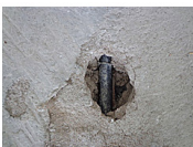
Nogmaals situatie dekvloer, met leiding vloerverwarming.