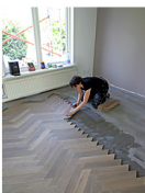
Saar Berks legt in de voorkamer.

"De vloer moest worden geplaatst op een ongeschikte zandcementen dekvloer, gedeeltelijk met vloerverwarming," zo schetst Berks de lastige beginsituatie. "Het geschikt maken is in samenwerking met Unipro tot stand gekomen. We moesten vaststellen dat de vloer op bijna alle belangrijke punten niet geschikt was. Hij was niet vlak. Hij was niet vast, in de zin van verzand en met losse tegellijm. Hij vertoonde scheuren en gaten. En hij was niet schoon, vanwege de vloerbedekkingslijm. Het probleem dat we moesten zien op te lossen was dat de dekvloer eerst moest worden verstevigd voordat er geëgaliseerd kon worden en het houtwerk gelegd."