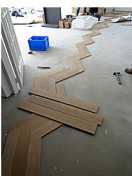
Uitzetten van de vloer.