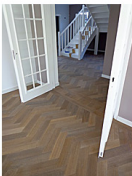
Vanuit de woonkamer met zicht op de trap in de hal.

"Deze proeve van bekwaamheid van Saar laat zien dat opleiding loont," zo wil Han Dorenbos graag nog benadrukken. "Zeker in combinatie met een stimulerende leeromgeving, zowel in het bedrijf, op school, als bij hoogwaardige activiteiten als het NKP, de workshops bij leveranciers en de activiteiten van het Gilde. Geef talent de kans om zich te ontwikkelen en het komt dubbel en dwars terug in de vorm van vakwerk. Saar is sinds twee jaar werkzaam bij mij in het bedrijf. In die tijd heeft zij een ongelooflijke ontwikkeling doorgemaakt in het parketvak."