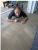
Sluitband tussen de verschillende ruimtes.