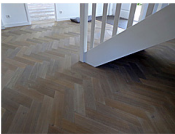
Doorlopend patroon rondom de trap.