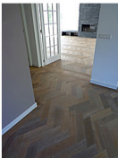
Vanuit de hal met zicht op de woonkamer.